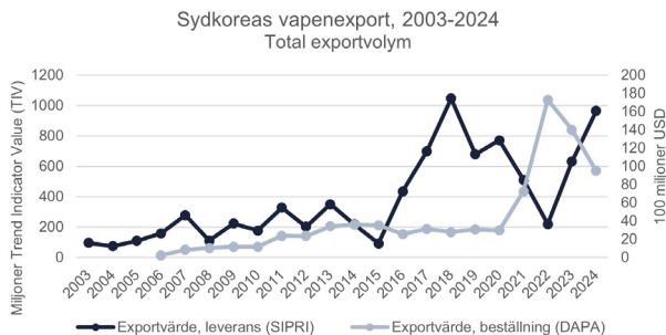
Figur 1. Graf över trender i Sydcoreas vapenexport de senaste 20 åren.

Sydkoreas försvarsindustri omsatte 2023 ca 140 miljarder SEK inom försvarsmateriel. Omsättningen har ökat ständigt sedan 2017 och tillväxten kommer sannolikt att hålla i sig, då de stora försvarsföretagen har fulla orderböcker.